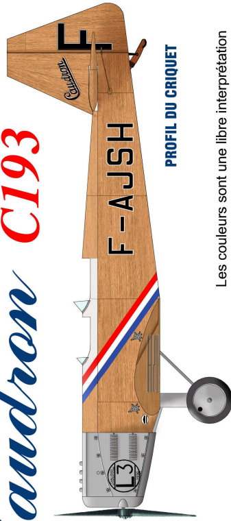
PROFIL DU CRIQUET

Les couleurs sont une libre interprétation de photos en noir et blanc